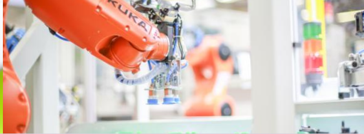
Produktion und automatisierte Fertigung